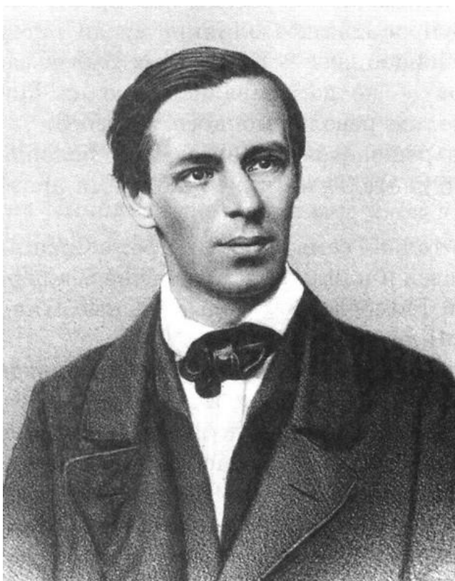
Аполлон Майков в молодости

живописи. Но всё же из-за близорукости, которой он страдал, выбирает поэзию. Так же этому выбору поспособствовала похвала его ранних произведений историка литературы Александра Никитенко и поэта Петра Плетнева.