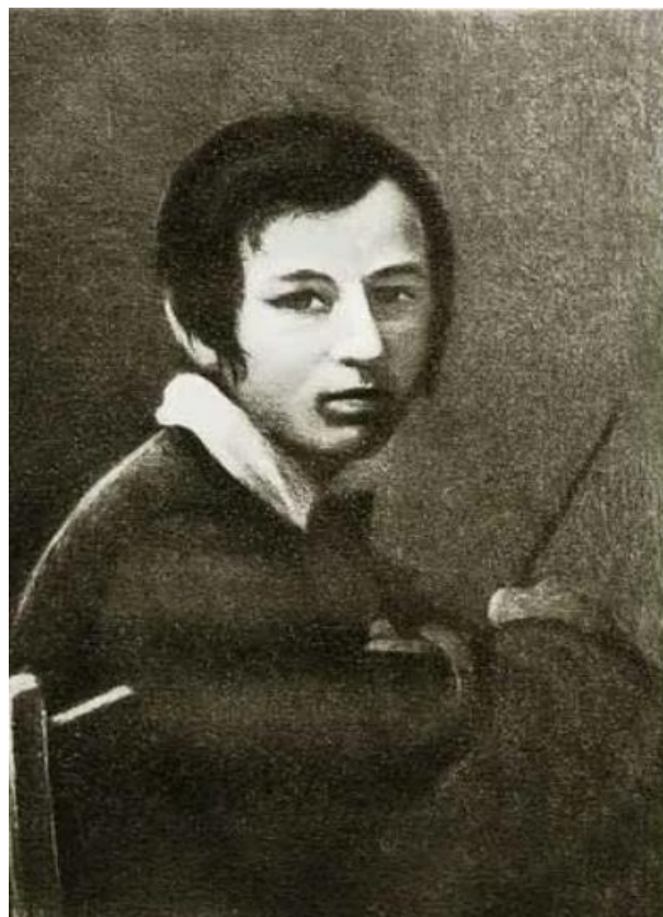
Аполлон Майков в детстве