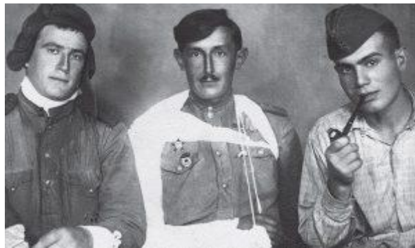
Виктор Некрасов в госпитале

Некрасов часто публиковался в различных литературных изданиях. Его статьи, рассказы, пьесы, очерки были посвящены Великой Отечественной Войне и роли в ней простого советского солдата.