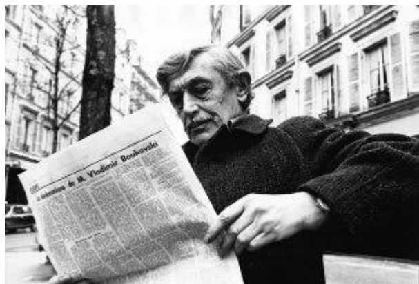
Виктор Некрасов в Париже

В последующие годы были написаны два романа: «Кира Георгиевна» и «В родном городе» , выпущен сборник рассказов о войне. За книгу «По обе стороны океана» писатель подвергся резкому обличению со стороны властей и был обвинен в идеализации Запада. Итогом этого послужило исключение из рядов КПСС. В это же время началась травля Некрасова. Ему отказывали все издательства, его клеймили на собраниях, объявляли строгие выговоры за то, что он посмел выразить мнение, не совпадающее с линией компартии.