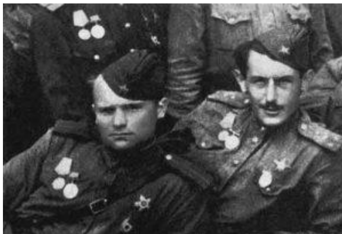
Фронтальная фотография Виктора Некрасова

Наряду с архитектурой и театром еще со школьных лет Виктор интересовался литературой. С одноклассниками он принимал участие в издании школьного журнала. Но талант его как писателя раскрылся намного позже. Пока же он поступает на службу в криворожский театр. До самого начала войны он выступает на театральных подмостках разных городов.