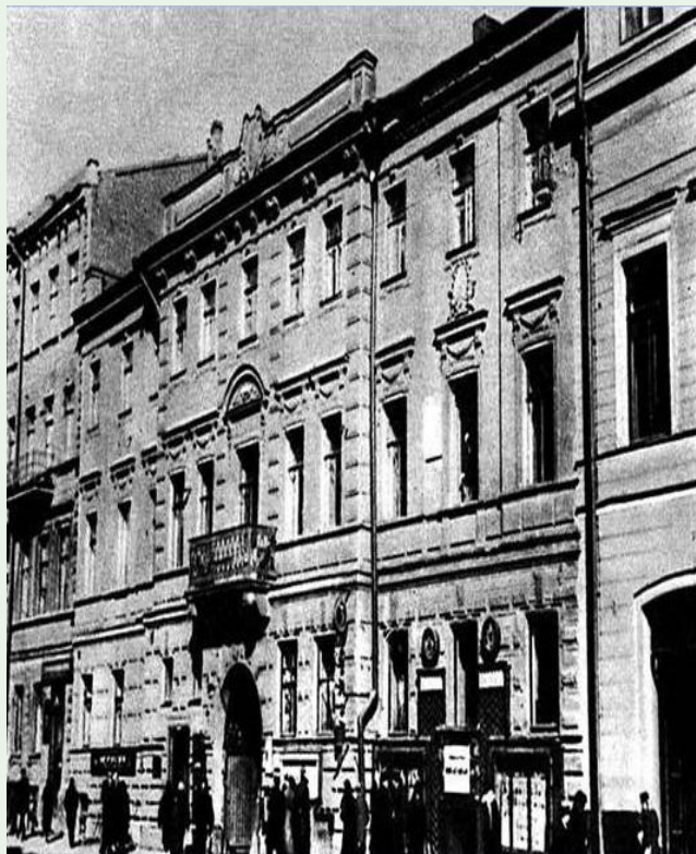
Дом в Петербурге, в котором жил М. Е. Салтыков-Щедрин

— в Рязань. Наблюдения за жизнью этих городов легли в основу «Писем о провинции» (1869 г.). Частая смена мест службы объясняется конфликтами с начальниками губерний, над которыми писатель «смеялся» в памфлетах-гротесках. После жалобы рязанского губернатора Салтыков в 1868 году был окончательно отправлен в отставку в чине действительного статского советника.