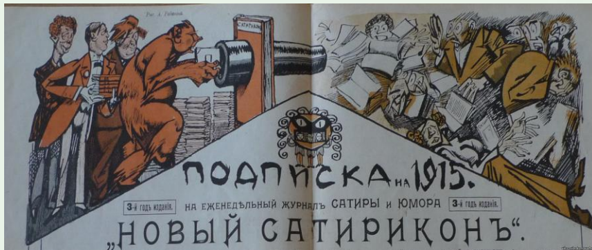
Из подписной рекламы 1915 г. Художник А. Радаков

программа. По замыслу сотрудников, их журнал «неустанно старался очищать и развивать вкус среднего русского читателя, привыкшего к полуграмотным распивочным листкам». Хлестко высмеивая бездарность, дешевые штампы («Неизлечимые», «Поэт»), Аверченко выступает поборником не просто талантливого, но и жизненного, реалистического искусства. Высмеивает крайности романтизма («Русалка»), теоретические постулаты «нового» искусства («Апполон»).