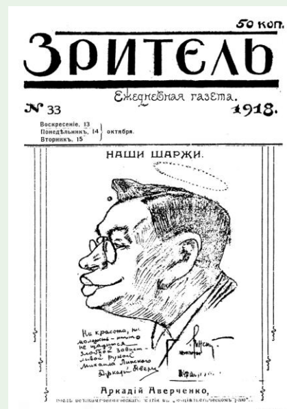
Автор шаржа – одесский карикатурист Михаил Линский. Шарж с обложки киевской газеты „Зритель“ (13-15 октября 1918 г.)

В 1913 г. из-за разногласий с издателем «Сатирикона» М. Г. Корнфельдом основные сотрудники выходят из состава редколлегии и основывают «Новый Сатирикон». С началом первой мировой войны появляются политические темы. Редакция разделяет мнение правительства о