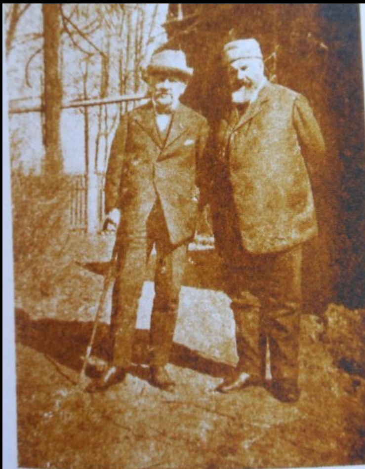
С.И. Танеев и М.И. Чайковский в Клину перед домом П.И. Чайковского в 1914 г.

«Про музыку я Вам скажу, что если была когда-нибудь написана музыка с искренним увлечением, с любовью к сюжету и к действующим лицам оно, то это музыка к «Онегину». Я таял и трепетал от невыразимого наслаждения, когда писал её. И если на слушателе будет отзываться хоть малейшая доля того, что я испытывал сочиняя эту оперу, то я буду доволен и большего мне не нужно».