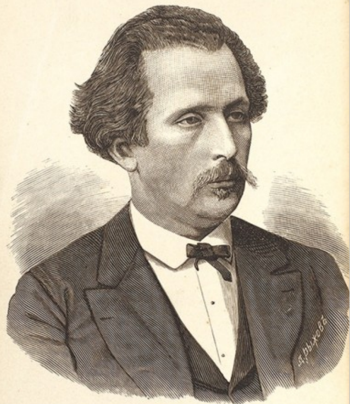
Н. Г. Рубинштейнъ, † 11 марта 1881 г.