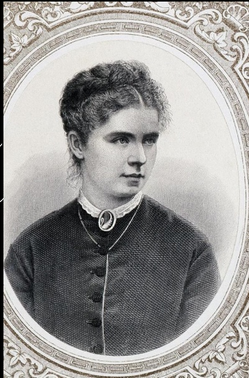
Елизавета Андреевна Лавровская