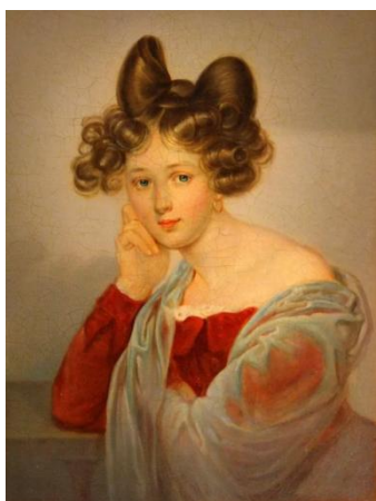
Портрет Элеоноры Тютчевой - первой жены Ф. Тютчева

По своей натуре Федор Тютчев был многолюбом. Первой его избранницей стала Амалия Лерхенфельд, являвшаяся внебрачной дочерью прусского монарха Фридриха Вильгельма. Ей посвящено несколько стихотворений, в числе которых знаменитый романс «Я встретил вас – и все былое...» (1870). Интересен факт, что на момент их знакомства девушке едва исполнилось 14 лет. Не менее интересно и то, что красотой Амалии восхищался и Александр Пушкин. Однако отношения Тютчева и Лерхенфельд до свадьбы так и не дошли. Девушка предпочла выйти замуж за состоятельного барона Крюднера.