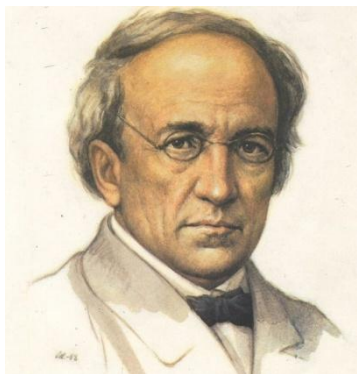
Федор Иванович Тютчев

Федор Иванович Тютчев родился 5 декабря 1803 года в семейной усадьбе Овстуг Орловской губернии, ныне – Брянская область. Он происходил из старинного русского дворянского рода, который был известен с XIV века. Отец поэта Иван Тютчев служил в Кремле, в последние годы жизни руководил «Экспедицией Кремлевского строения» – государственной организацией, которая следила за состоянием исторических памятников. Мать Федора Тютчева Екатерину Толстую публицист Иван Аксаков описал как «женщину замечательного ума».