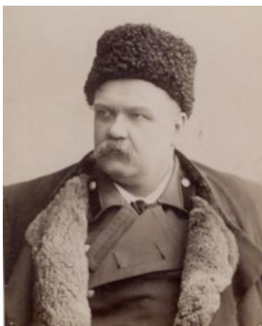
Владимир Алексеевич Гиляровский