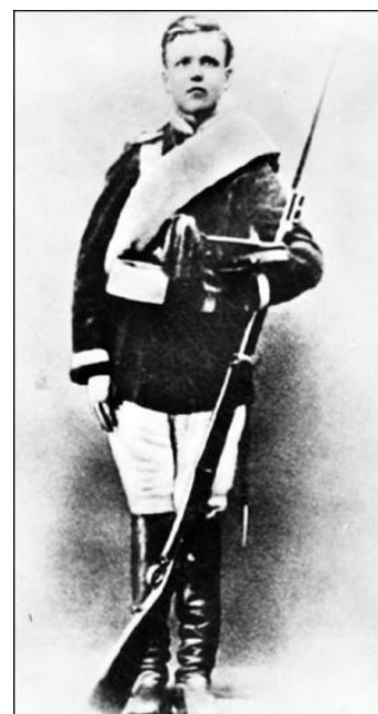
В. А. Гиляровский в молодости

20 дней шёл с лямкой по Волге от Костромы до Рыбинска. Затем в Рыбинске работал крючником в порту. Осенью того же года поступил на службу вольноопределяющимся в Нежинский полк. В 1873 году был направлен в Московское юнкерское училище, где проучился около месяца, после был отчислен в полк за нарушение дисциплины. Службу, однако, продолжать далее не стал, написав рапорт об отставке.