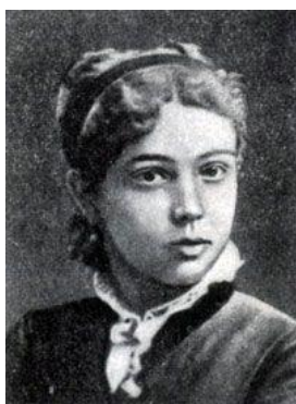
Анна Алексеевна Бренко

Далее работал истопником на белильном заводе купца Сорокина в Ярославле. Затем пожарным на рыбных промыслах. Позже в Царицыне нанялся табунщиком, а в Ростове-на-Дону поступил наездником в цирке. В 1875 году начал работать актёром в театре. Выступал на сценах Тамбова, Воронежа, Пензы, Рязани, Саратова, Моршанска, Кирсанова и т.д. С началом русско-турецкой войны снова пошёл в армию вольноопределяющимся, служил на Кавказе в 161-м Александропольском полку в 12-й роте, после перешёл в охотничью команду, был награждён Знаком Отличия Военного ордена святого Георгия IV степени, светлобронзовой медалью «За русско-турецкую войну 1877-1878», медалью «В память 300-летия дома Романовых».