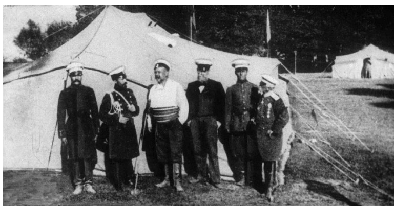
Празднование 25-летия Шипкинских сражений.

Владимир Гиляровский позировал для художника Ильи Репина при написании знаменитого полотна «Запорожцы пишут письмо турецкому