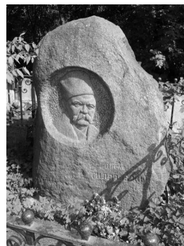
Памятник из метеорита на могиле В. А. Гиляровского. Скульптор С. Меркуров

В 1966 году именем Гиляровского названа улица в Мещанском районе Москвы (бывшая 2-я Мещанская). Имя писателя носят улицы в Вологде и Тамбове. Имя Гиляровского присвоено одной из малых планет Солнечной системы. В феврале 2015 года, к 160-летию со дня рождения Владимира Гиляровского, администрация города Вологды передала Вологодскому региональному отделению Союза российских писателей старинное здание на улице Чернышевского, 15, под Литературную резиденцию «Дом Дяди Гиляя». В 2017 году к 162-летию со дня рождения Гиляровского был открыт филиал музейного объединения «Музей Москвы» Центр Гиляровского – выставочное пространство без постоянной экспозиции, в котором помимо временных выставок проходят кинопоказы, а также работает лекторий.