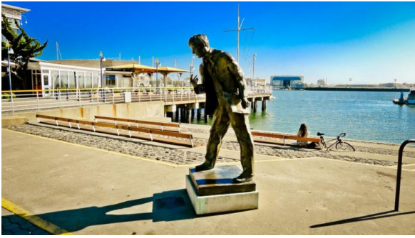
Памятник Джеку Лондону

Незадолго до смерти он завершил «Сердца трёх» («Hearts o Three»). Впервые роман был опубликован в 1919–1920 годах на страницах вечерней газеты «New York Journal American». Всего же за 17 лет