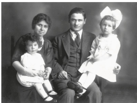
Джек Лондон с женой Элизабет Маддерн и детьми

Джек Лондон всегда стремился показать человека в сложной, часто опасной ситуации, требующей быстрых и решительных действий. Реалистические и довольно подробные описания обстоятельств Лондон сочетает с духом романтики и приключений. Писатель всегда очень быстро погружал читателя в действие своего произведения, а характеристику героям давал через их мысли и диалоги.