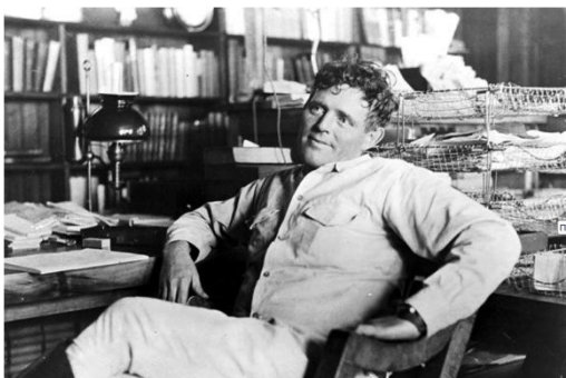
Писатель Джек Лондон