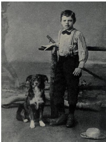
Джек Лондон в детстве