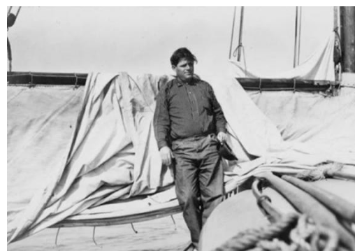
Джек Лондон в плавании