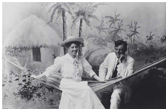
Джек Лондон и Чармиан Киттредж

красавицей, да и ума у нее не наблюдалось, частенько становилась предметом шуток всех знакомых, потому что питала страсть ко многим мужчинам. Чем она могла привлечь такого человека, как Лондон, долго оставалось загадкой. А потом выяснилось, что она забрасывала