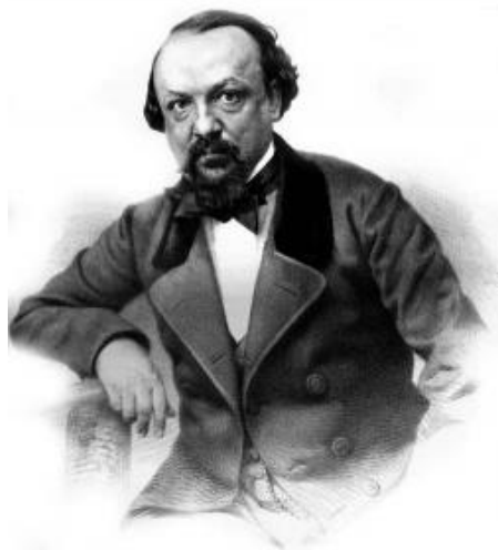
Алексей Феофилактович Писемский