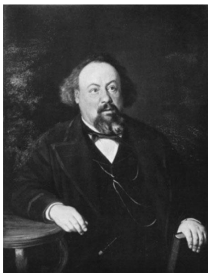
Писемский А. Ф. Портрет работы В. Г. Перова. 1869 г.

В 1866 г. Писемский опять поступил на государственную службу. С переездом в Москву совпадает поворот в направлении творчества и явное ослабление художественных сил Писемского. С этого времени им овладевает «памфлетическое отношение к сюжетам», пронизывая не только боевые изображения современности, но и картины отжившего быта. К последним относятся драмы, появившиеся в 1866–1868 годах в журнале «Всемирный