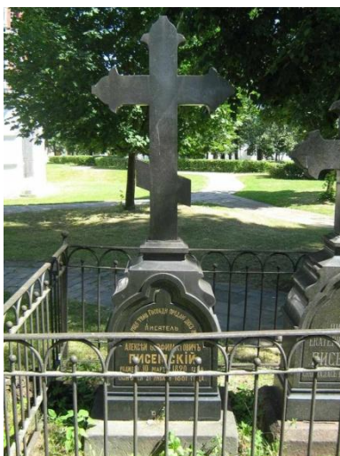
Могила А. Ф. Писемского. г. Москва, Старое кладбище бывшего Новодевичьего монастыря

литературы, погребение его представило разительный контраст с похоронами умершего почти в то же время Достоевского.